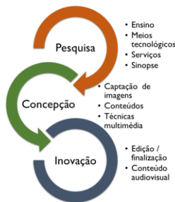
Esq. 1 / Produção audiovisual.