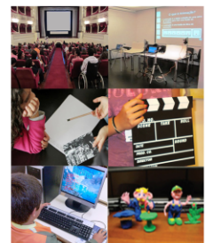
Fig. 1 / Contextos de aprendizagens e eventos.

Os trabalhos devem ser submetidos para aprovação no site do programa Educamedia ou através de e-mail para educamedia@live.madeira-edu.pt .