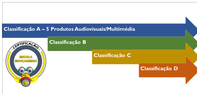
Grf.1 / Certificação "Escola Educamedia" – Classificação.

O projeto pretende ainda dar um contributo para o aprofundamento de estudos nesta área.