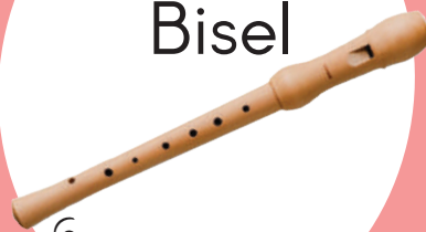
Flauta de Bisel