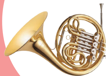
Trompa de harmonia