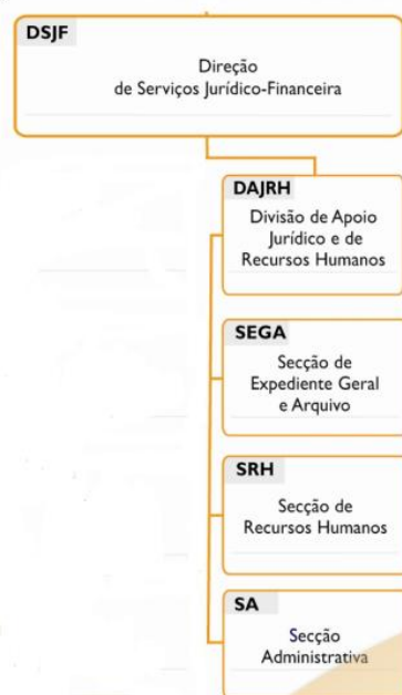
Figura 2.Organograma DAJRH